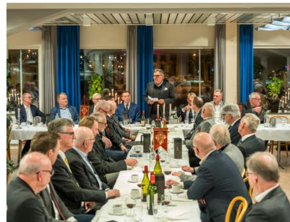
90 Bröder samlades i Parkhallen denna kväll. De flesta var medlemmar av någon av de fyra Talanggrenarna; Theatern, Musiken, Kören eller Lekarne.

Om världen i övrigt tycks utom kontroll, finns alltid Talangerna i Par Bricole!