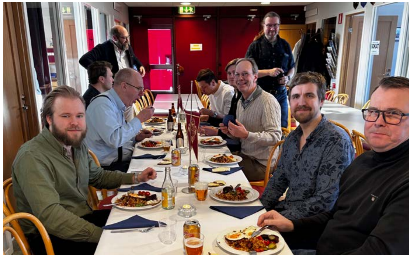
Arbetsmötet kunde fortsätta även under den fantastiska lunchen som våra duktiga Kanslietraktörer dukat fram åt utvecklarteamet.