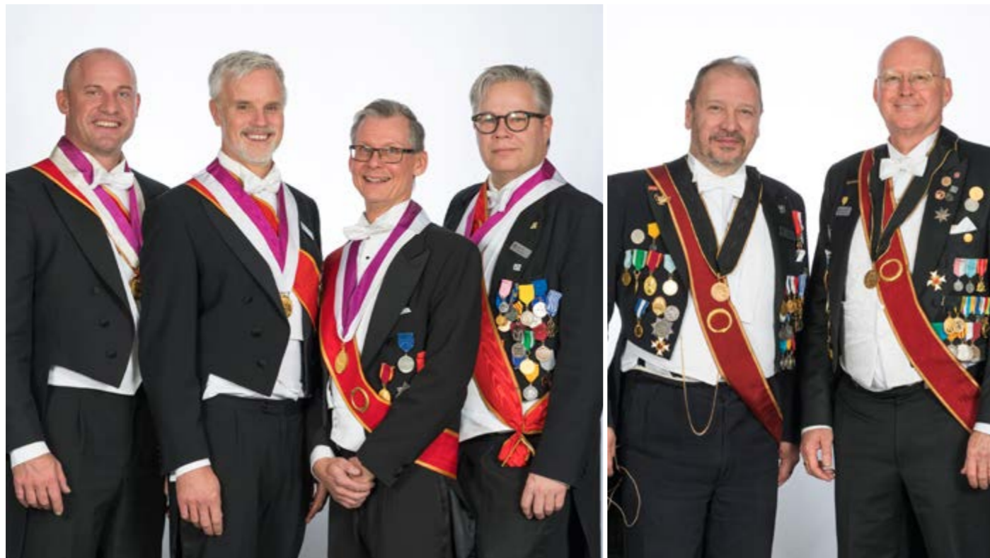
Recipiender Grad 8 (Guvernörer)